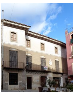
21-Casa Pastell Pl. dels Homes