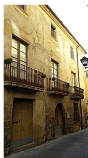
24-Casa Mayor C. Font Calvera, 2