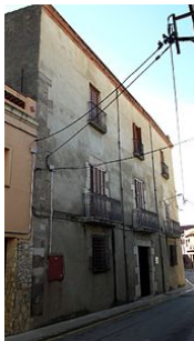
33-Casa Garrigoles Pl. de la Llana, 7.