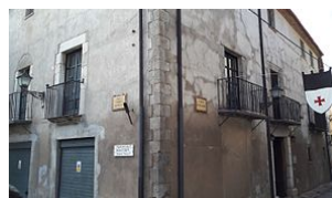
34-Casa Cassanyes Pl de les Monjes, 5