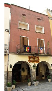
23-Can Calet Plaça dels Homes.